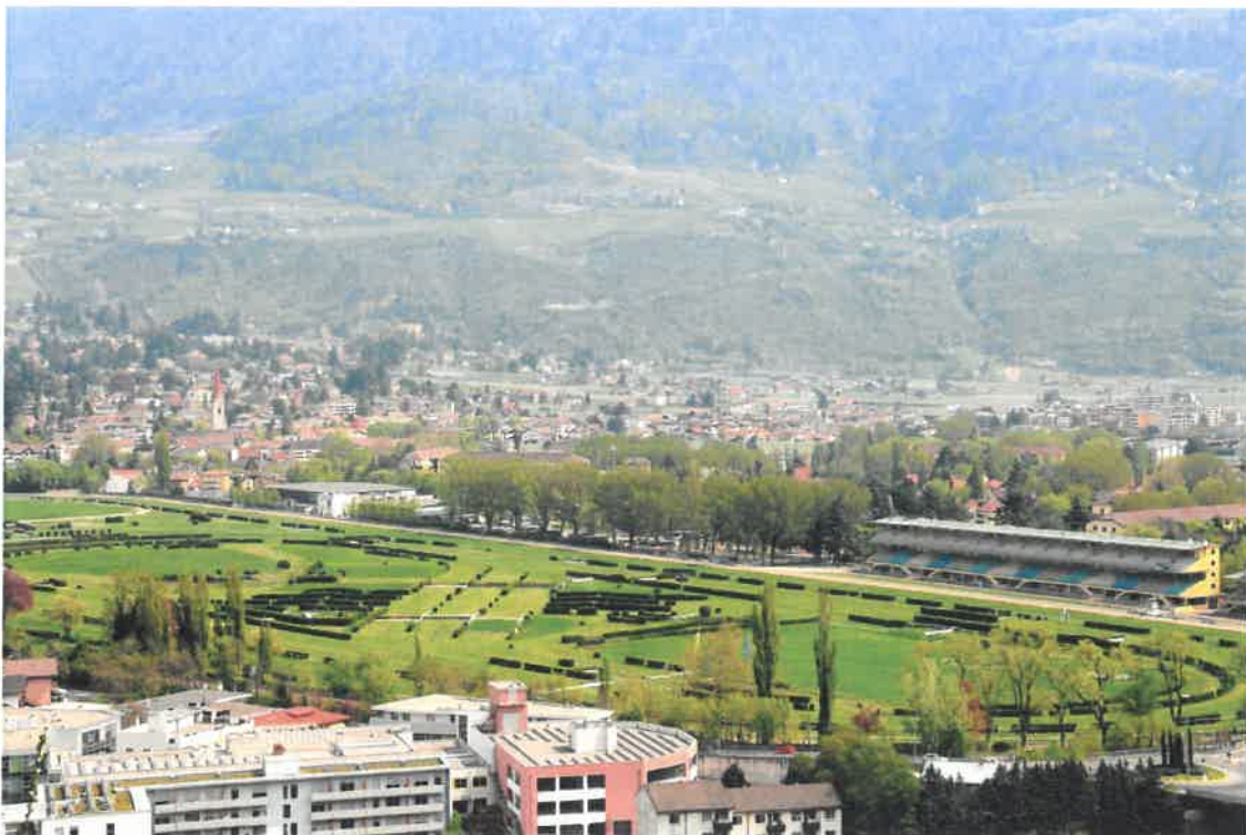
Vista dell'Ippodromo di Merano e di parte della città