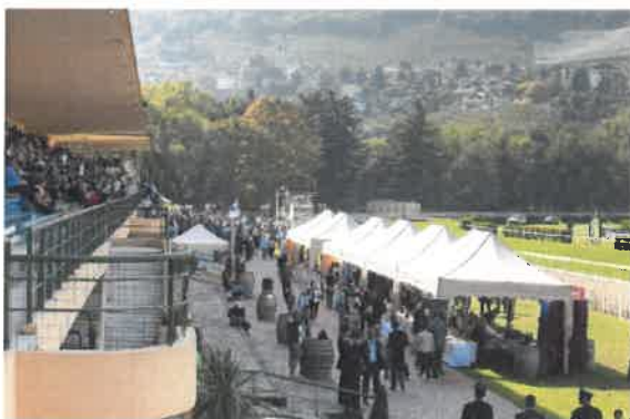
Stand enogastronomici - Partnership