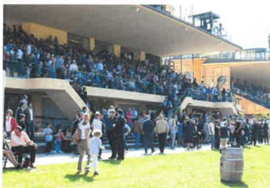
Tribune e parterre- presenza nazionale ed internazionale